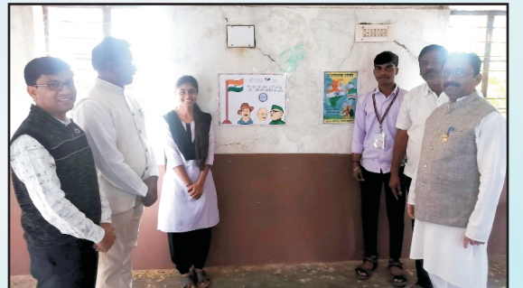
स्वातंत्र्यवीर सुभाषचंद्रबोस यांच्या जीवनावर आधारित पोस्टर स्पर्धेत सहभागी विद्यार्थी