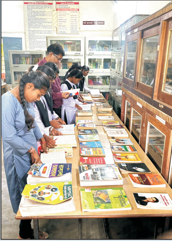
भारतीय ग्रंथालय आणि माहिती शास्त्राचे जनक डॉ. एस. आर. रंगनाथान यांच्या जन्मदिनानिमित्त ग्रंथ प्रदर्शनीचे आयोजन