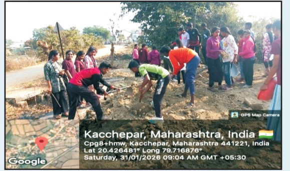
Kacchepar, Maharashtra, India Cpg8+hmw, Kacchepar, Maharashtra 441221, India Lat 20.426481° Long 79.716876° Saturday, 31/01/2026 09:04 AM GMT +05:30