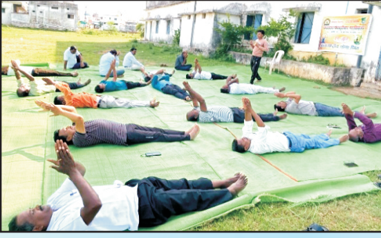
आंतरराष्ट्रीय योगदिनी योगासन करतांनी महाविद्यालयातील कर्मचारी आणि विद्यार्थी