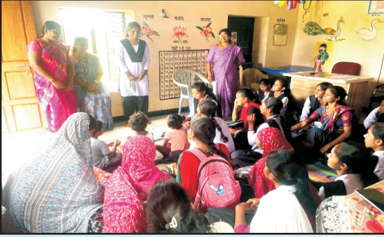
पोषण सप्ताहानिमित्त गृह अर्थशास्त्र विभागाच्या वतीने अंगणवाडी भेटीचे आयोजन