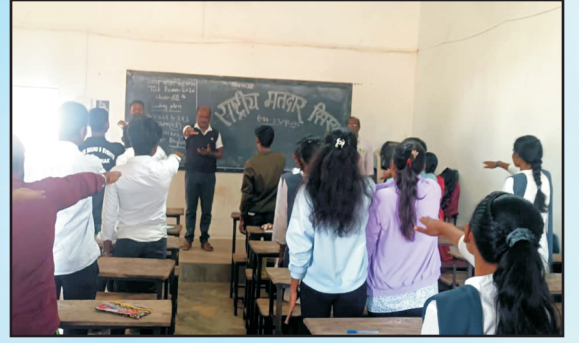
मतदानाची शपथ घेऊन मतदार दिवस साजरा करण्यात आला