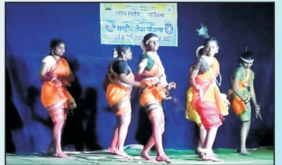
नववर्षानिमित्त आयोजित खेळ व सांस्कृतिक महोत्सव, वर्ग बाराविकरिता निरोप समारंभ