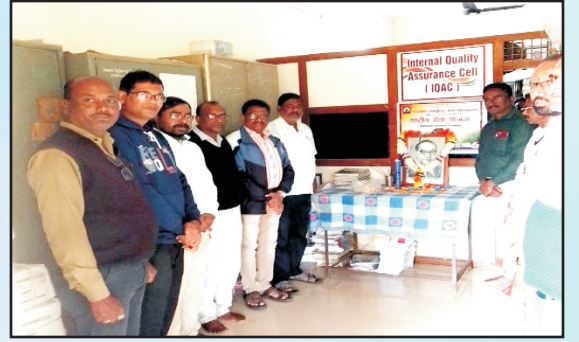
भारतरत्न डॉ. बाबासाहेब आंबेडकर यांच्या महापरिनिर्वाण दिनाला उपस्थित महाविद्यालयीन कर्मचारी.