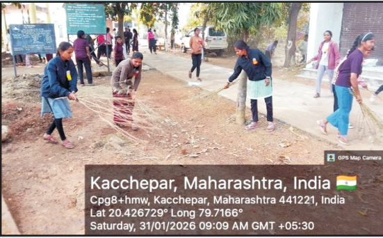
Kacchepar, Maharashtra, India Cpg8+hmw, Kacchepar, Maharashtra 441221, India Lat 20.426729° Long 79.7166° Saturday, 31/01/2026 09:09 AM GMT +05:30