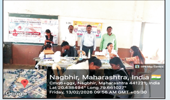
रासेयो विभाग आणि राष्ट्रीय स्वयंसेवक संघ लोककल्याण समिती नागपूर संयुक्त विद्यमाने रक्त तपासणी शिबीर